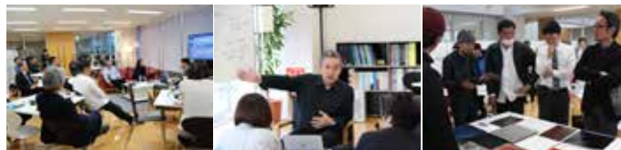
写真：昨年度開催の様子

あわせて、参加者全員で各回のテーマに沿ったディスカッションを行い、新たなプロジェクトのきっかけをつかみます。