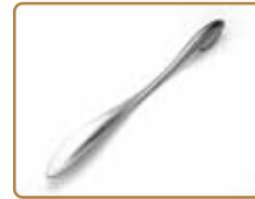
靴ペラ AQUARIUM #002

男たるもの、自分のこだわりを貫いた生活を送りたい…そんな理想の生活を手に入れるためのこだわり男子プロダクト。