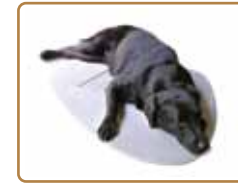
ペット用冷却ボード COOLPLATE