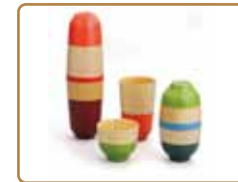
TEA SET、TUMBLER SET