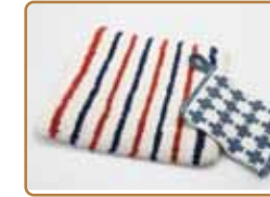
手織りの椅子敷き